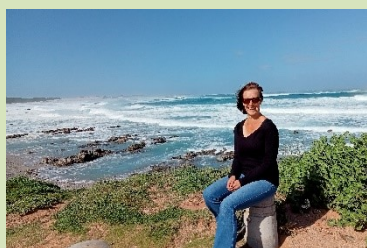
Aan de kust bij een ruige zee