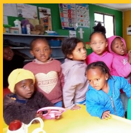
↑ Pre school Doop bij FREE →