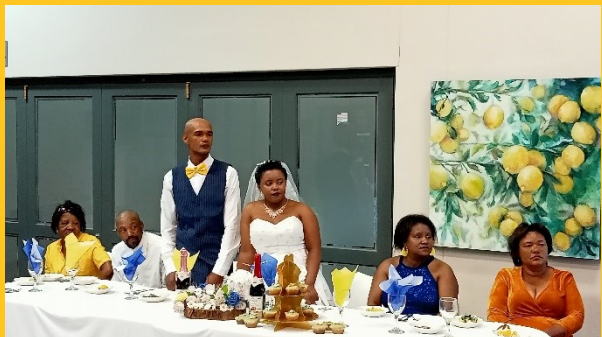
Bruidspaar FREE deelnemers → In de pauze bij FREE